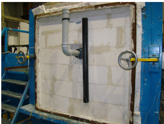
Foto 1 – Proefstuk aan de niet-direct verhitte zijde, voor aanvang van de brandproef